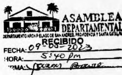
EVERTH HAWKINS SJOGREEN Gobernador